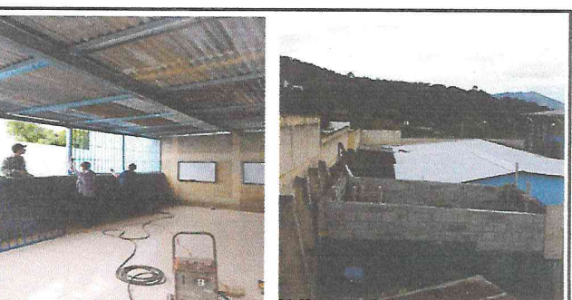
Foto 6: Realizando trabajos de colocacion de balcones y sustitucion de lámina, por lámina troquelada y estructura del techo de cocina.

Observación: Si es necesario se pueden agregar hojas adicionales y actualizar el número de hojas.