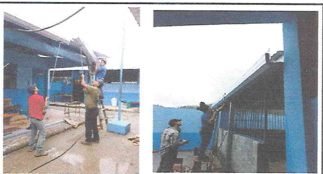
Foto 4: Realizando la colocación de los canales en las caidas de agua