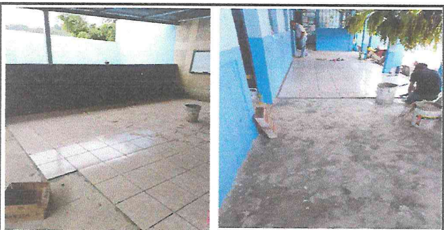
Foto 5: Realizando trabajos de colocación de piso cerámico en cuatro aulas y un corredor